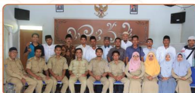
Staff dan Perangkat Desa