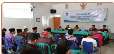
Edukasi Sadar Bencana