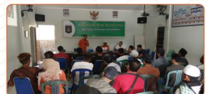
Pelatihan Budidaya Peternakan dan Pertanian